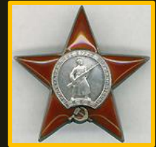
Řád Rudé hvězdy