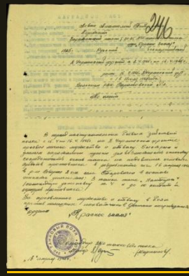
Za Starovičky Levin