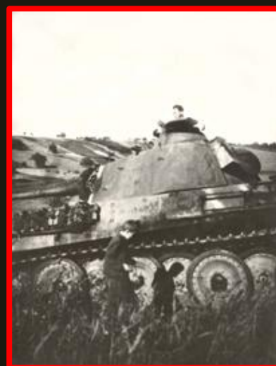
Vraky tanků na bojišti