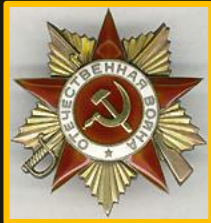
Řád Vlastenecké války I. stupně