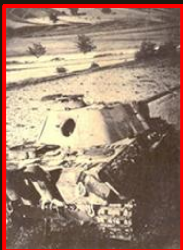
Vraky tanků na bojišti