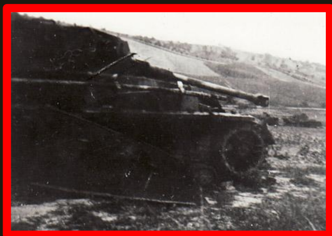
Jeden ze zničených německých tanků