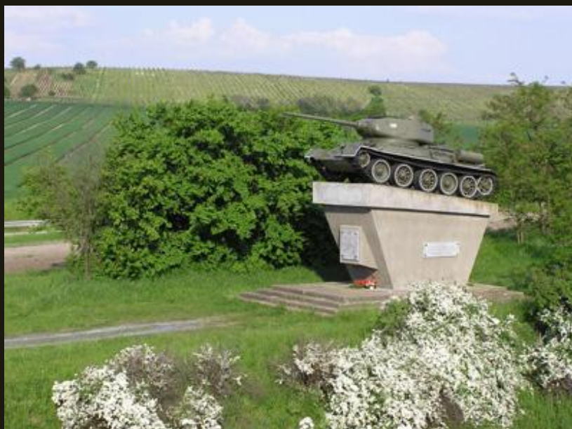
Památník tankové bitvy u Staroviček