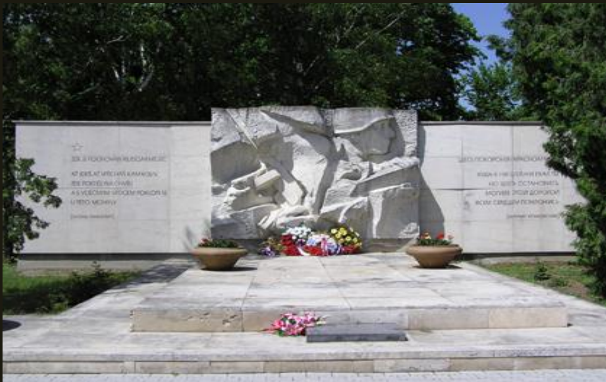
Hřbitov Rudé armády v Hustopečích