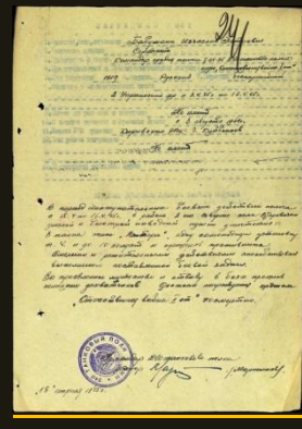
Za Starovičky Babuškin