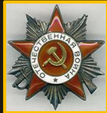
Řád Vlastenecké války II. stupně