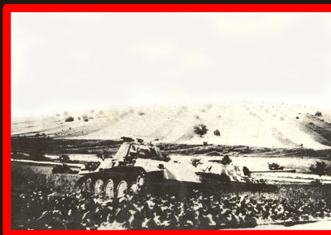
Místo bojů s vraky zničených tanků