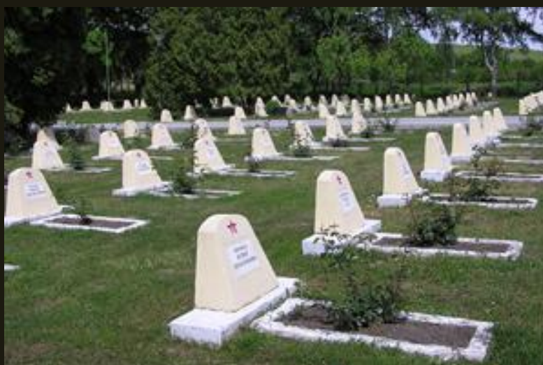
Řidič Vasilij Kudrjašov a střelec Sláva Babuškin jsou pochováni na hřbitově Rudé armády v Hustopečích.